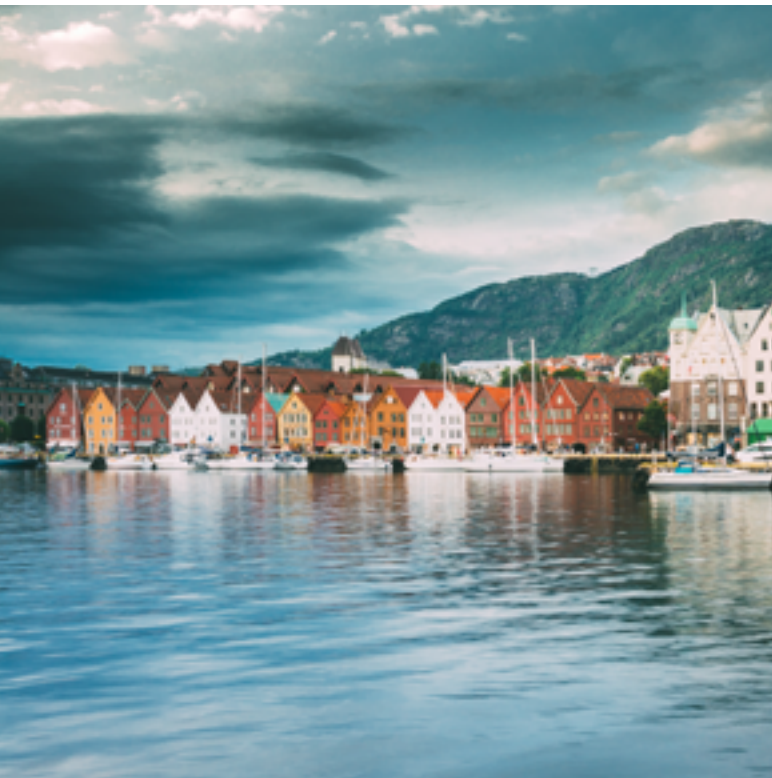
Bryggen i Bergen