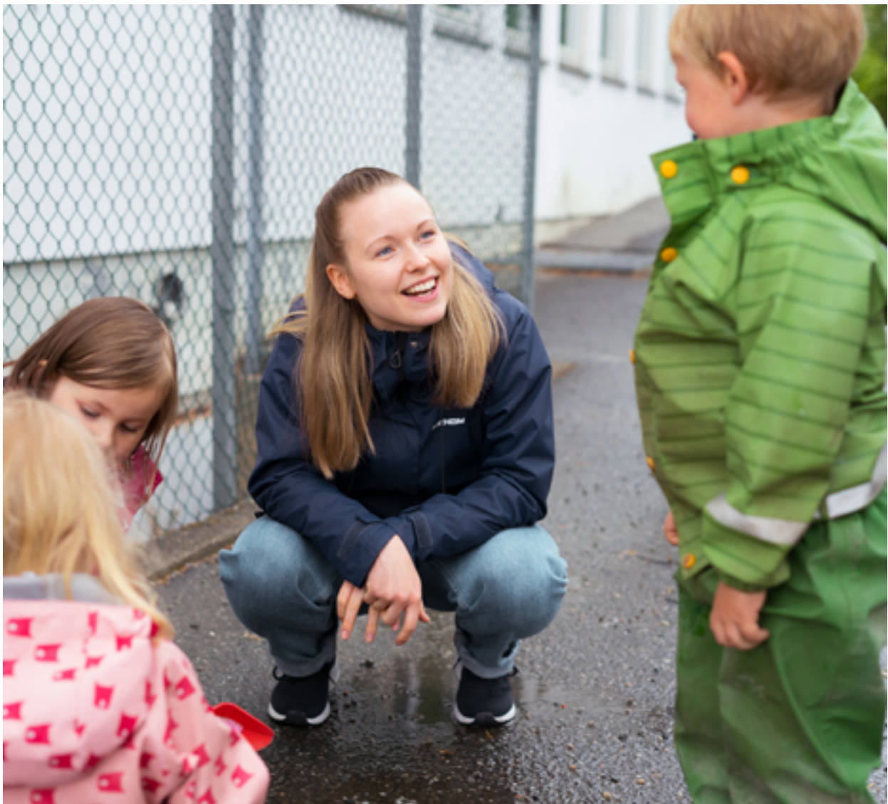
Barnehagelærerstudentene har 105 dager i praksis gjennom sine tre studieår.

Det arbeides også kontinuerlig med digital kompetanse gjennom samarbeid med skoler og barnehager i DeKomp/Rekomp.