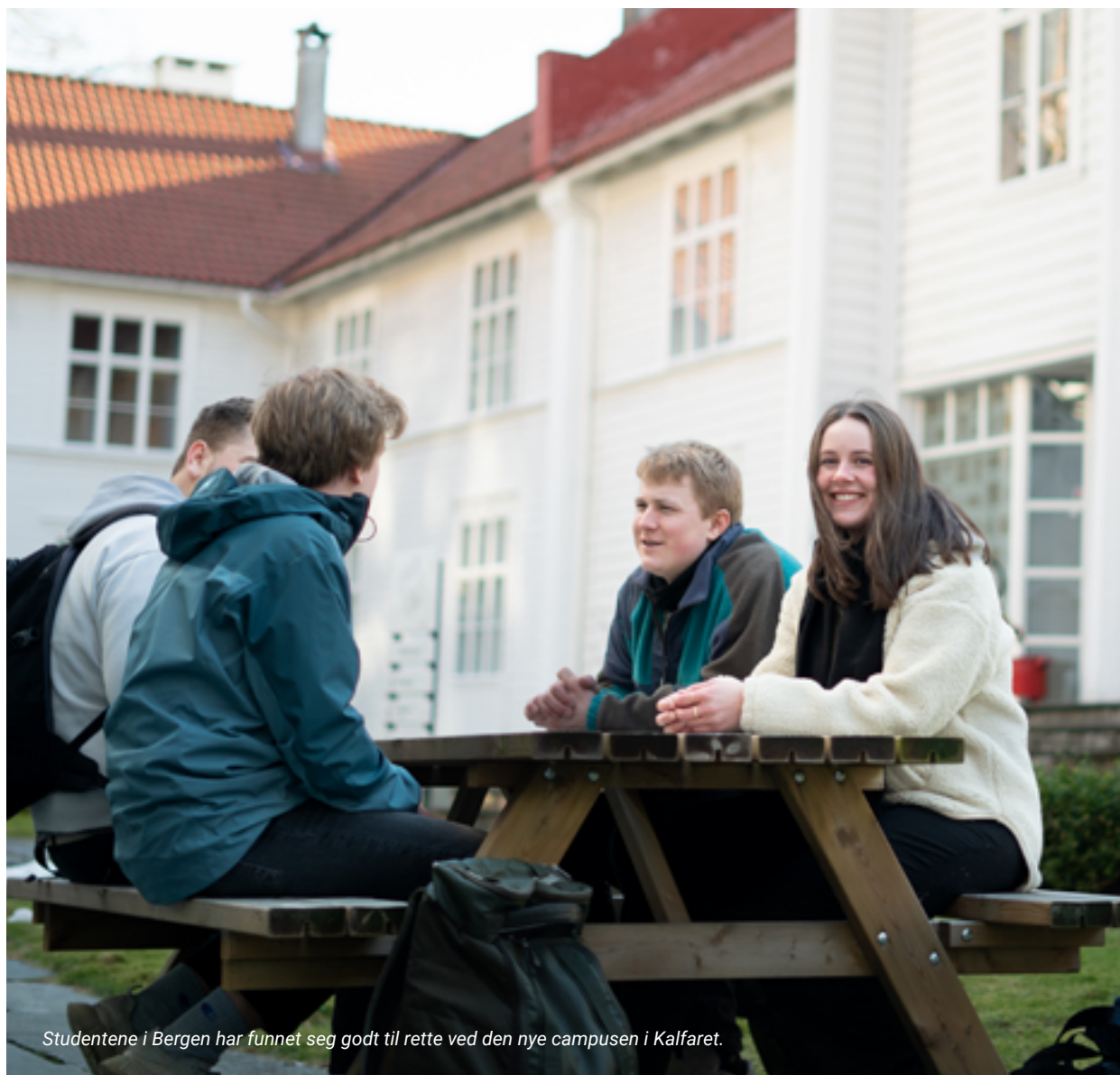
Studentene i Bergen har funnet seg godt til rette ved den nye campusen i Kalfaret.

NLA Høgskolen legger vekt på å delta i nasjonale undersøkelser, og det er ønskelig å trekke frem to undersøkelser som høgskolen har deltatt i 2023. Studentenes helse- og trivselsundersøkelse (SHoT) kartlegger studentenes helse og trivsel i bred forstand. Formålet er å gi innsikt i hvordan studentene har det, og hvordan velferdstilbudet til studenter kan bedres. I 2023 fikk våre studenter invitasjon til en tilleggsundersøkelse, hvor tema for denne undersøkelsen var rus og psykiske lidelser blant studenter. Den andre undersøkelsen er studiebarometeret, som er en nasjonal spørreundersøkelse om studiekvalitet som årlig sendes ut til over 70 000 studenter. Det er studenter på 2. og 5. år på bachelor- og mastergradsstudier som får svare på undersøkelsen, og i undersøkelsen svarer studentene på en skala fra 1 til 5 (les mer om begge undersøkelsene i kapittel III).