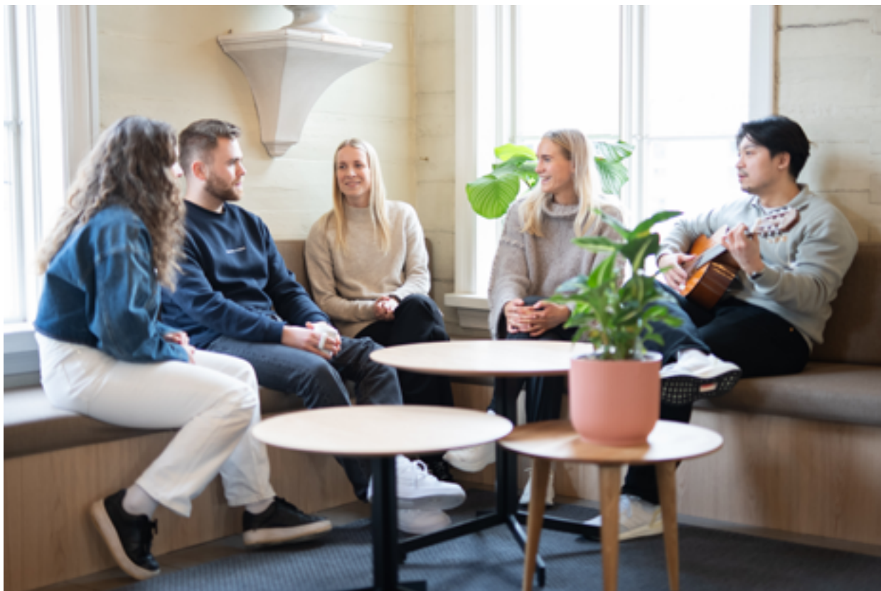
Januar 2024 flyttet lærerstudentene i Bergen inn i ny campus i Kalfaret.

De fire punktene der NLA skårer dårligst på institusjonsnivå, handler om arbeidslivrelevans, men i det minste går det riktig vei både for høgskolen og nasjonalt. På spørsmålene om arbeidslivsrelevans er gjennomsnitt på NLA 3,0, en oppgang på 0,1 fra i fjor. Nasjonalt er gjennomsnittet 3,2, en oppgang på 0,2 fra i fjor. Spørsmålene om arbeidslivsrelevans måler studentenes oppfatning av institusjonens innsats for å informere om arbeidslivsmuligheter og integrere arbeidslivet i studiene.