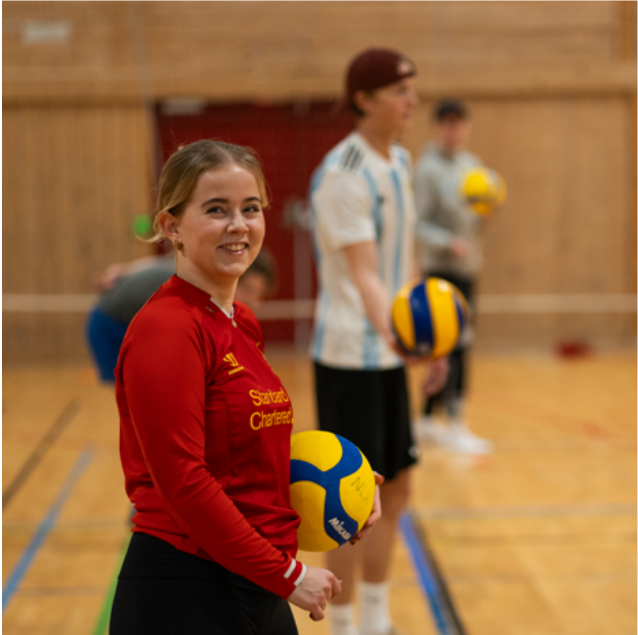
Fra høsten 2024 utvider NLA Høgskolen sitt idrettstilbud og tilbyr grunnskolelærerutdanning med vekt på kroppsøving.