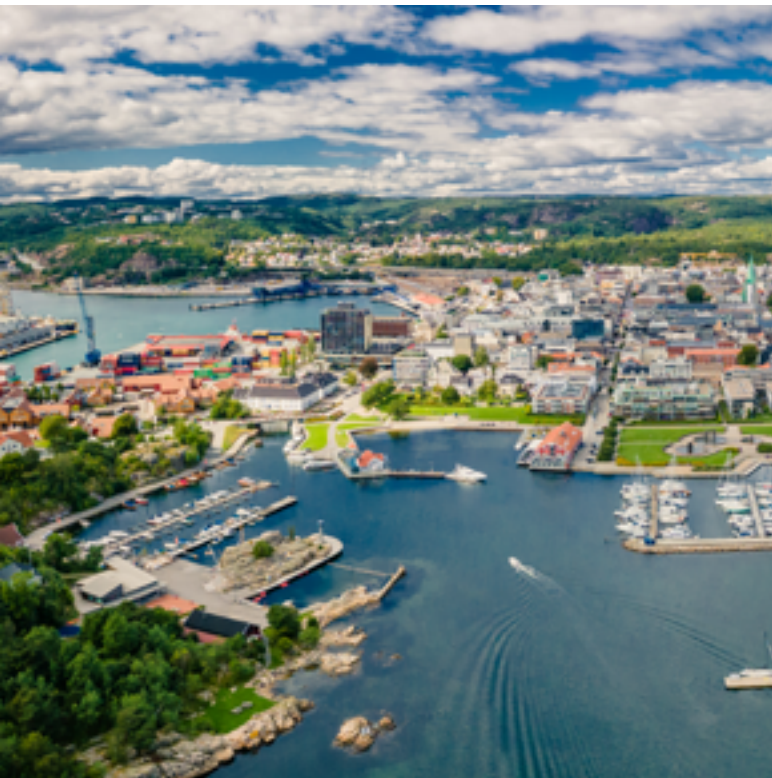
Kvadraturen i Kristiansand