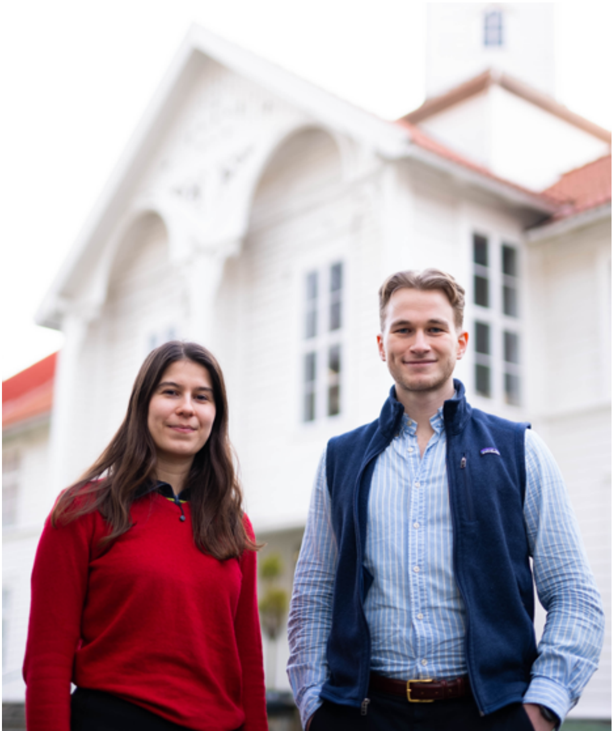
Ung Kapital har gjennomført seminarer i personlig økonomi på alle fire campuser til NLA Høgskolen. Bedriften Ung Kapital er opprettet av tidligere studenter ved Hauge School of Management.

All virksomhet ved NLA Høgskolen kommer inn under akkreditert høgskolevirksomhet, og det er dermed ikke annen aktivitet som skal holdes regnskapsmessig adskilt. Høgskolen driver ikke virksomhet som ikke kommer inn under universitets- og høyskoleloven. Alle studier som ikke gir studiepoeng, understøtter akkrediteringen. Det har vært noe utleie/framleie av overskuddskapasitet i institusjonens lokaler som opprinnelig har vært anskaffet for akkrediterte formål, men det meste av slik utleie er avviklet siden NLA Høgskolen nå trenger arealet selv. I 2023-regnskapet har det blitt gjort en større avsetning knyttet til «husleie for ubrukte lokaler i resterende kontraksperiode», nærmere omtalt i del I og del VI.