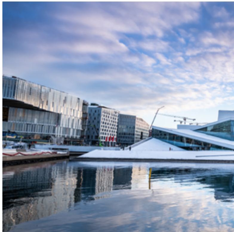
Operahuset i Oslo