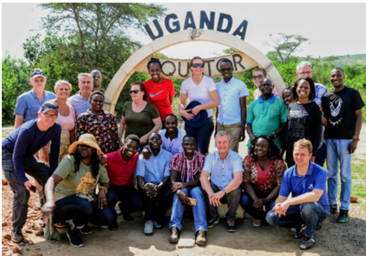
Fra avslutningsworkshopen i Uganda hvor prosjektdeltakere fra NLA, Uganda Christian University og University of KwaZulu-Natal feiret målene som ble oppnådd i nåværende prosjekt, som varte fra 2013 til 2020.