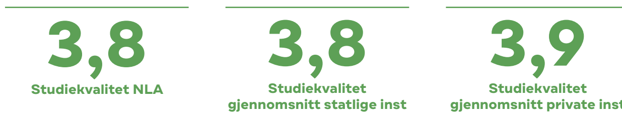
Tabell 9: Skår på hvordan studentene oppfatter studiekvaliteten (Studiebarometeret/styringsparametre DBH)

Ifølge Studiebarometeret opplever studentene ved NLA Høgskolen at studiekvaliteten er på nivå med gjennomsnittet for statlige institusjoner, og litt lavere enn for statlige institusjoner. Den sank litt i 2022, fra 4,0 til 3,9, og videre til 3,8 i 2023. Nasjonalt er det betydelige variasjoner mellom ulike studieområder i opplevd studiekvalitet.