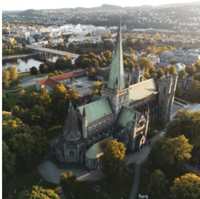
Nidarosdomen i Trondheim